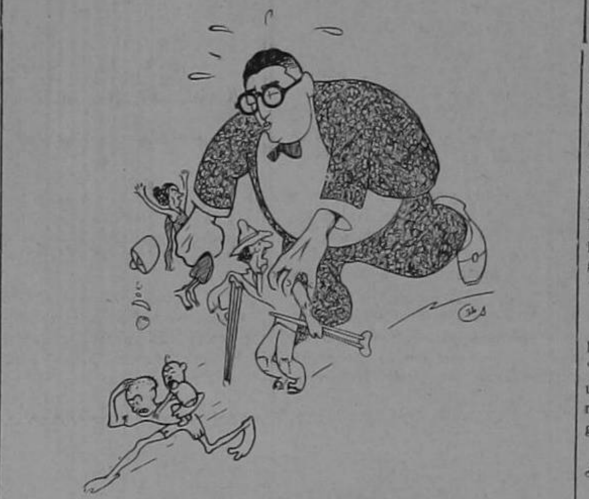
En el Congreso don Manolo haría una buena repela.